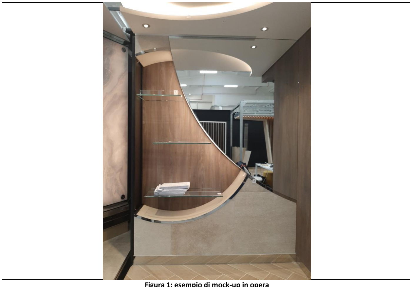
Figura 1: esempio di mock-up in opera

Questo elaborato di tesi è stato sviluppato nell'ambito dell'allestimento di interni navali su grandi navi, in particolare sulle navi da crociera. La tesi riguarda lo studio, lo sviluppo e la realizzazione di mock-up navali per la zona spa di una nave da crociera: viene fornito un inquadramento generale del contesto di riferimento, per capire il metodo con cui vengono realizzati; successivamente vengono analizzate singolarmente le fasi di realizzazione a partire dal momento in cui i disegni esecutivi vengono acquisiti dall'ufficio tecnico, fino a quando i mock-up vengono consegnati al committente. Nella parte conclusiva viene svolta un'analisi critica dell'intero processo.